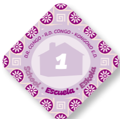
República Democrática del Congo